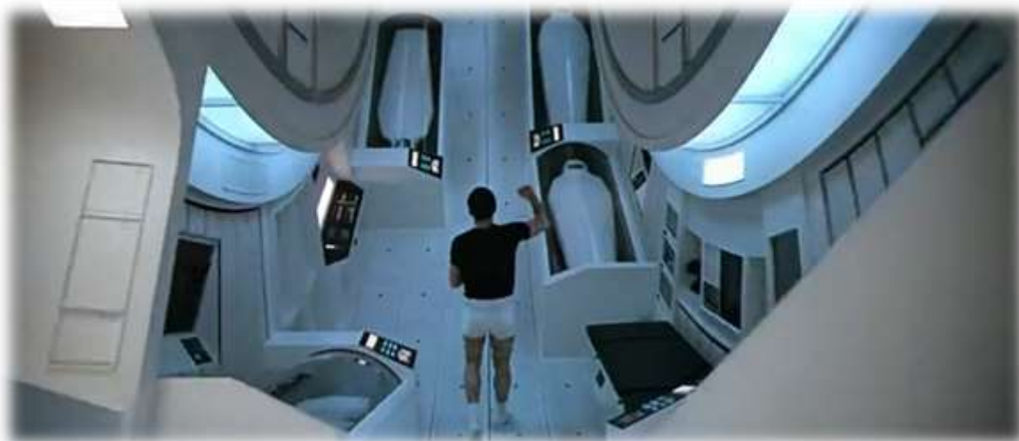
Рис. 2 Внутренний интерьер жилого отсека космического корабля Discovery One (кадр из фильма «Космическая одиссея 2001 года»)